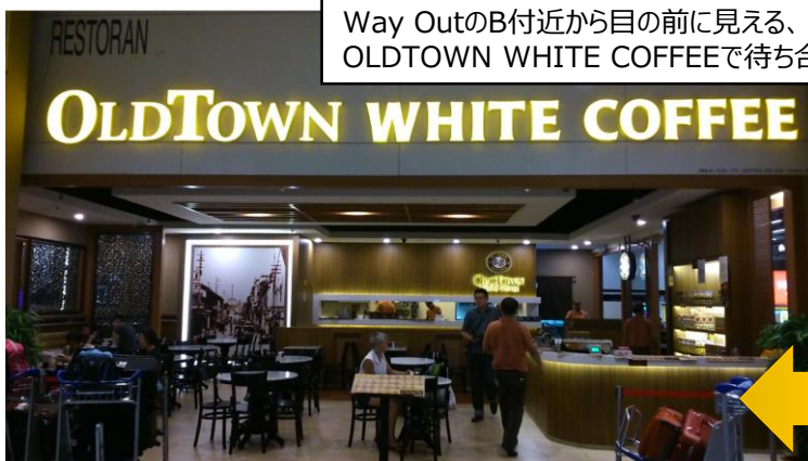
Way OutのB付近から目の前に見える、 OLDTOWN WHITE COFFEEで待ち合わせ