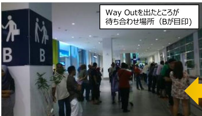
Way Outを出たところが 待ち合わせ場所（Bが目印）