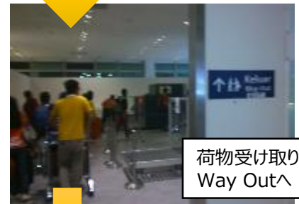
荷物受け取り後 Way Outへ